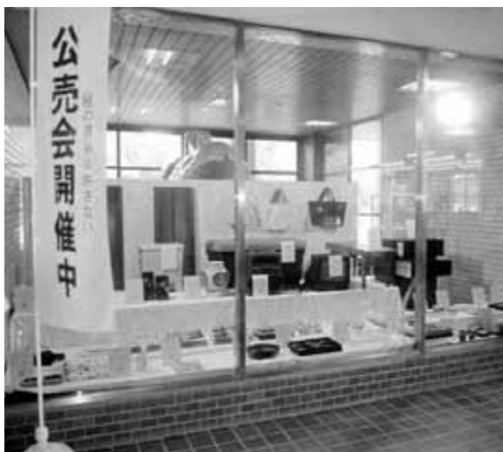
差押えた動産の公売会の様子(役場玄関ロビー)