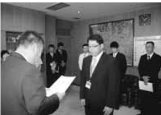
中逸町長から辞令を交付される玉東町職員ら

これは、玉名郡内の4町が相互に税務職員を派遣することで、各町の町税を徴収することを可