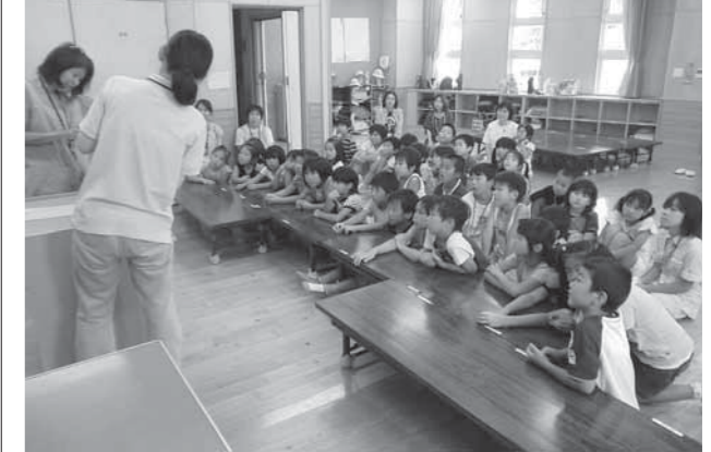
▲ボランティアによる読み聞かせの風景(放課後子ども教室と合同開催)