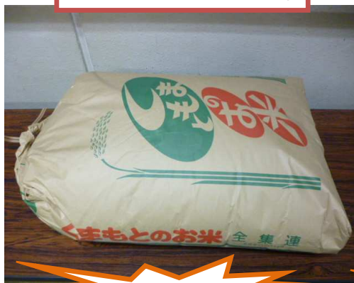
新米(玄米)ヒノヒカリ 30kg