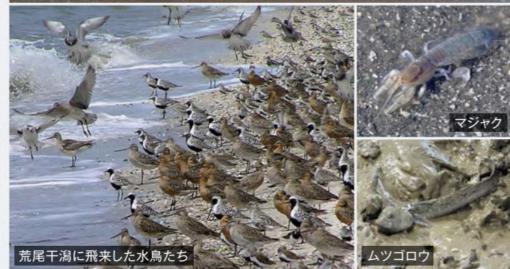
荒尾干潟に飛来した水鳥たち