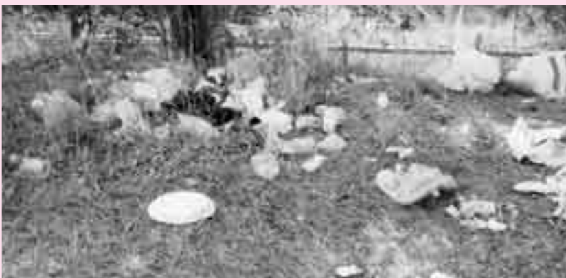
▲ごみの不法投棄が絶えない新塘公園

不法投棄は廃棄物処理法で禁止されています。違反した場合は、5年以下の懲役もしくは1,000万円以下の罰金適用されます。すでに新聞などで報道されているように、空き地に不法投棄し、逮捕された事例もあります。