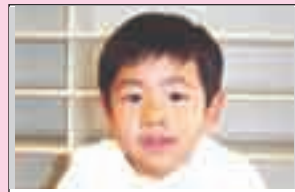
中津海智水くん (清源寺)