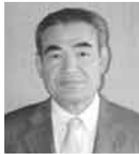
～プロフィール～ 生まれ: 昭和21年9月生 (59歳) 住居: 建浜 趣味: ジョギング

先の第1回長洲町議会定例会(3月)におきまして町長のご推挙を受け、議員の皆様のご同意を頂きまして、4月1日付で助役に就任いたしました。どうぞ、宜しくお願い致します。 これまで長洲町役場職員として36年間お世話になりました。