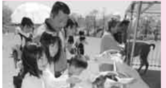
なんさまきてみなっせ市