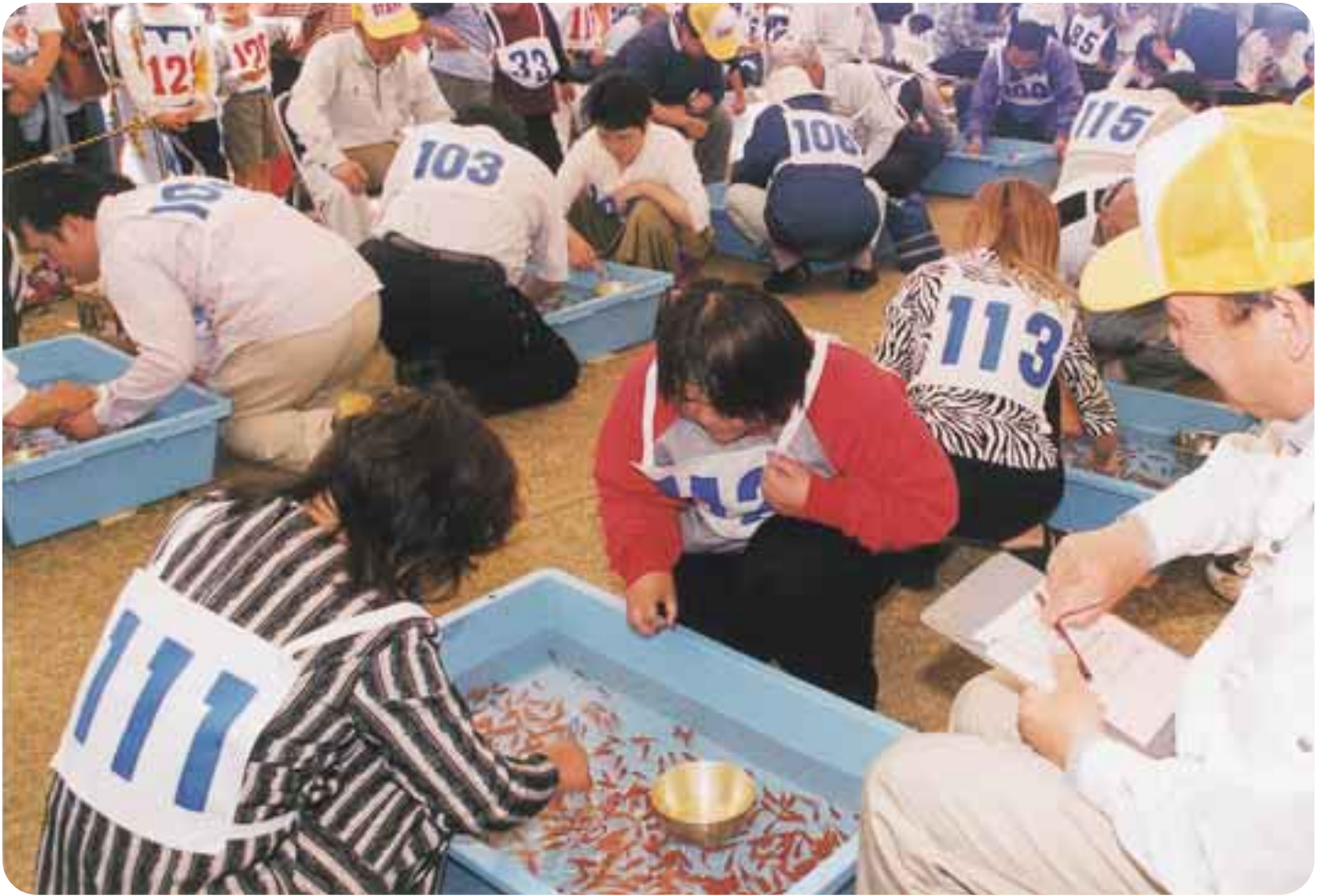
▲金魚すくいに挑戦する参加者