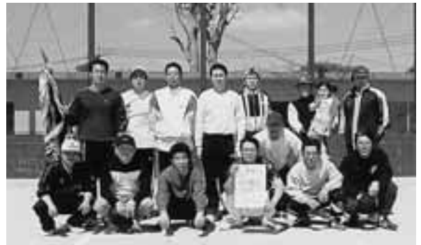
▲ 優勝した大明神チームの皆さん