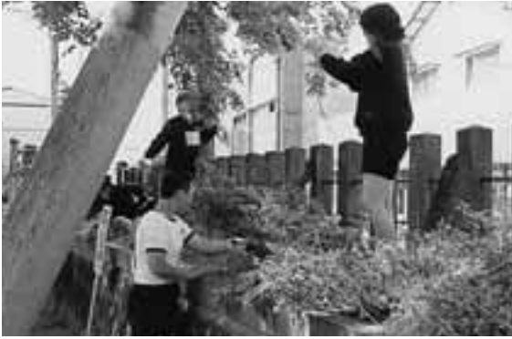
◆ “ふるさとを美しく” と清掃作業を行う生徒たち