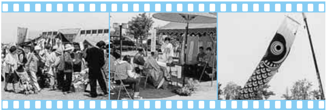
▲ 多くの人で賑わいをみせたフリーマーケット『なんさま来てみなっせ市』 ▲ 野点のコーナー ▲ 70mのジャンボ鯉のぼり

フリーマーケット「なんさま来てみなっせ市」、野点のコーナー、ジャンボ鯉のぼりの掲揚が行われ、なんさま来てみなっせ市には約90店の出店があり、会場は朝早くから出店者とお客さんでいっぱいでした。