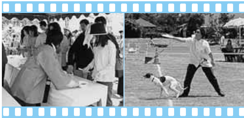
▲ 行列ができたぜんざい無料サービス ▲ いろんな種類の犬が出場したディスクドッグ大会

また、ディスクドッグ大会にはいろんな種類の犬が参加し、会場は犬好きの人たちでいっぱいでした。