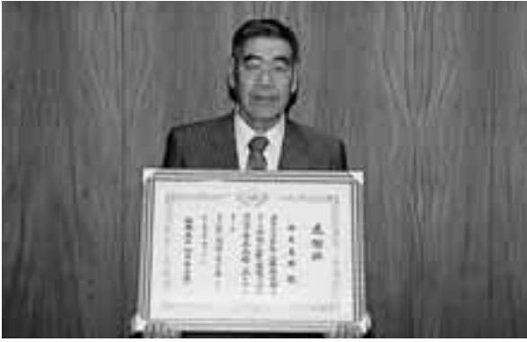
▲ 感謝状を受けた中尾さん