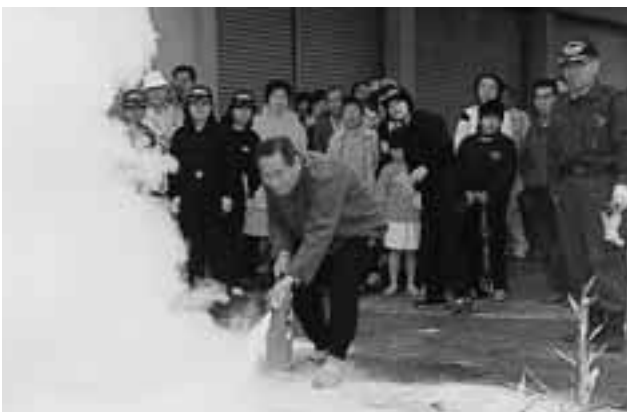
▲ 消火器を上手に操作する参加者

実際に消火器を使った訓練を体験された方は「慌ててしまい最初は説明どおりにできませんでした。いつもはテレビでみているだけで実際に行う機会がなかったので、今日はとても貴重な体験ができました。」と話されていました。