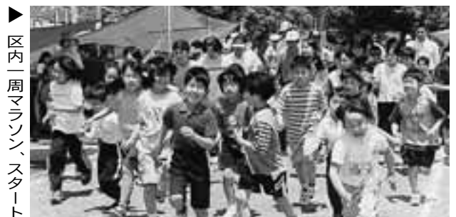
区内一周マラソン、スタート

両区とも汗ばむ陽気の中、趣向を凝らした競技が繰り広げられ、区民一体となって盛り上がりました。