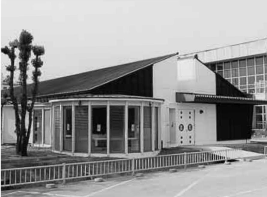
▲ 木材をふんだんに使用し人や環境に優しい造りの保健センター

住民の健康づくりの拠点施設として、建設が進められてきた保健センター(愛称:すこやか館)が、6月12日(月)役場南側にオープンします。 総事業費1億3千2百万円をかけて建設されたこの施設では、健康教室・健康相談・健康診査・予防接種・乳幼児医療費助成受付等の総合的な保健事業を行います。 皆さんが気軽に立ち寄ることができ、様々な交流の場として利用できる施設を目指しています。 今回は、施設の概要を紹介します。