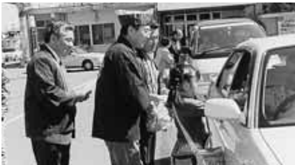
▲ 「交通安全で素敵な旅に。」