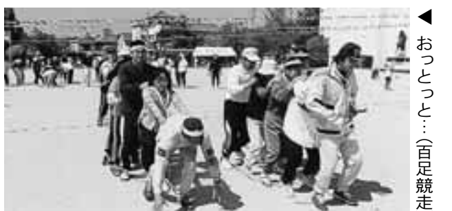
おっとっと…(百足競走)