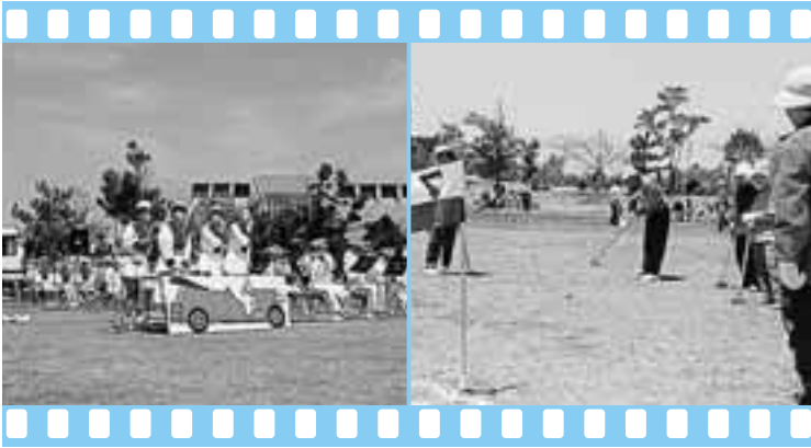
▲ 熊本県警音楽隊による演奏 ▲ 交通グラウンドゴルフ大会

晴天に恵まれた3日間、各イベントが行われ、会場は家族連れなど多くの人でにぎわいました。