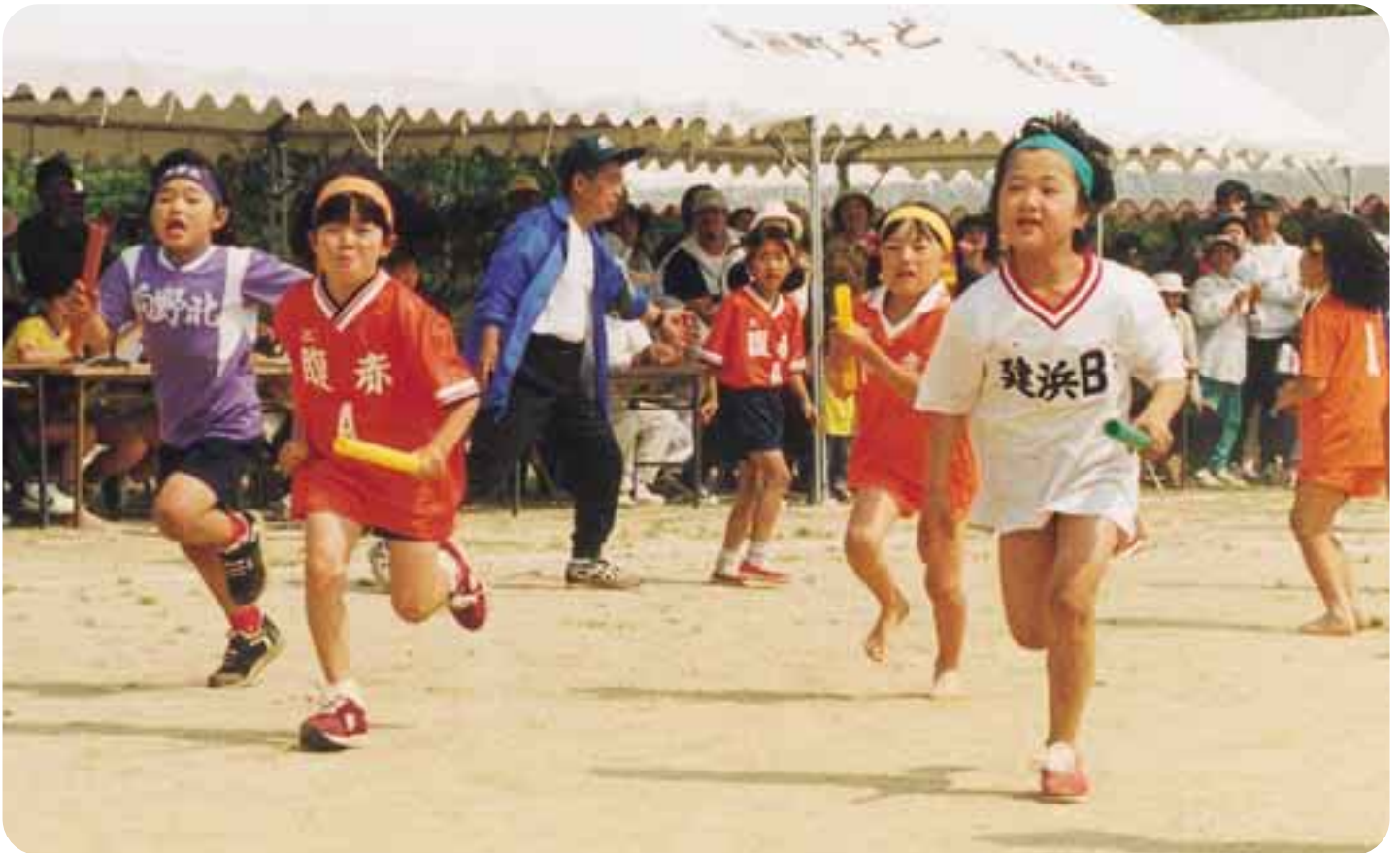
▲「ファイトー」お父さんやお母さんからの声援を受けて走る子どもたち