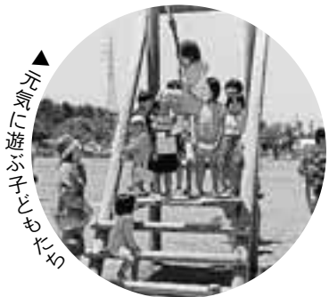
元気に遊ぶ子どもたち