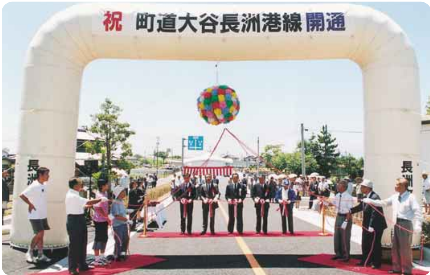
テープカットの瞬間