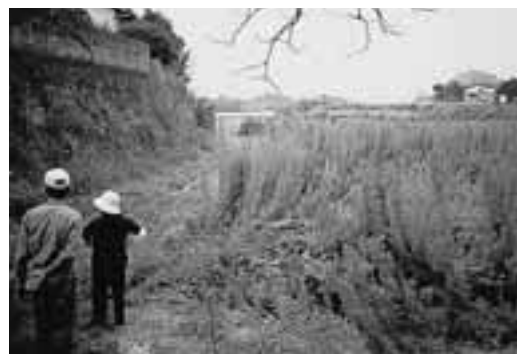
セイタカアワダチ草が繁茂した休耕地