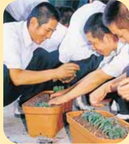
総体に向け花を育てる高校生

来年開催される「ひのくに新世紀総体」の成功に向けて、約7万人の県内高校生が選手としてがんばるとともに、競技補助員・公開演技・吹奏楽・合唱・草花装飾・各種歓迎事業等に「一人一役」を合言葉としてがんばります!