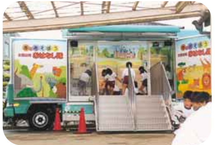
自分好みの絵本を選びます