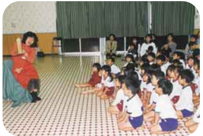
みんな紙芝居に夢中