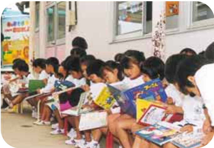
選んだ絵本を交換しながら読みました