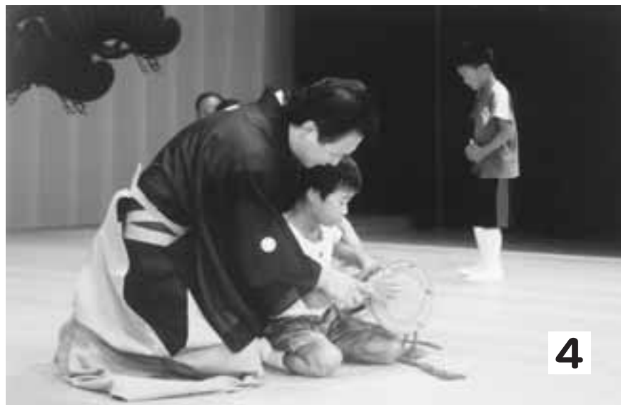
昨年度の様子(能楽)▶