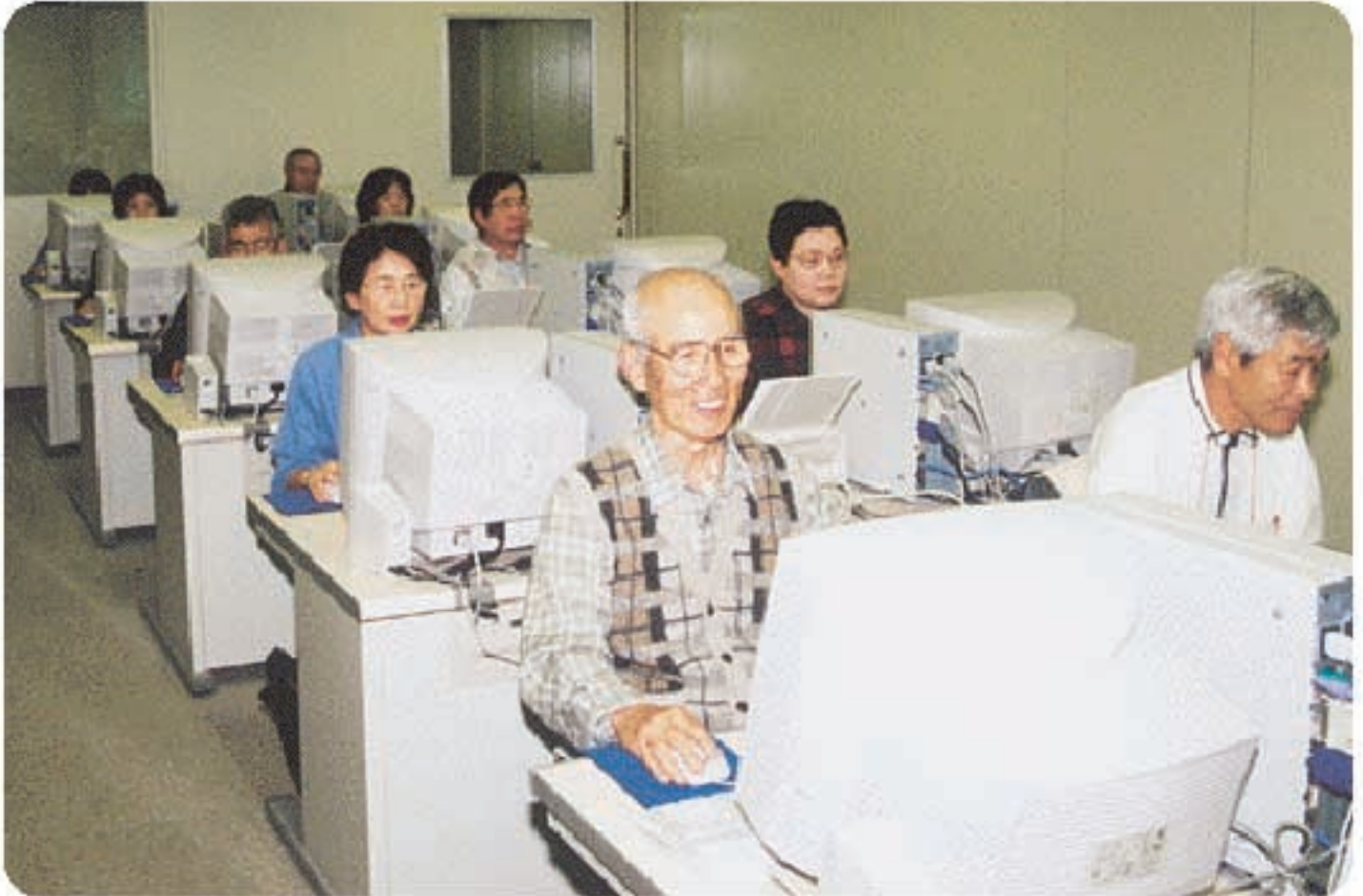
▶ 熱心に講習を受ける受講者たち