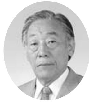
中逸 章二 商業 中町 当5