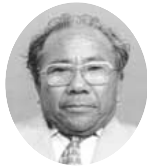
濱田 惲 農業 清源寺 当3