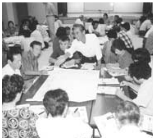
▲ワークショップの風景

第一回目の協議会では、各グループに分かれ討議するワークショップにより活発な意見・提言等が出され、大変有意義なものとなりました。 今後も、次の日程により協議会を開催しますので、住民の皆さんの参加をお待ちしています。