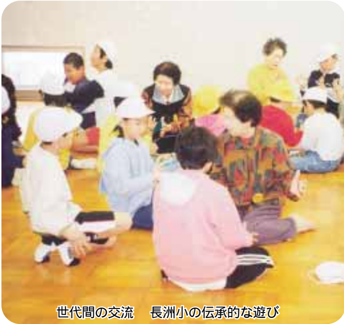
世代間の交流 長洲小の伝承的な遊び