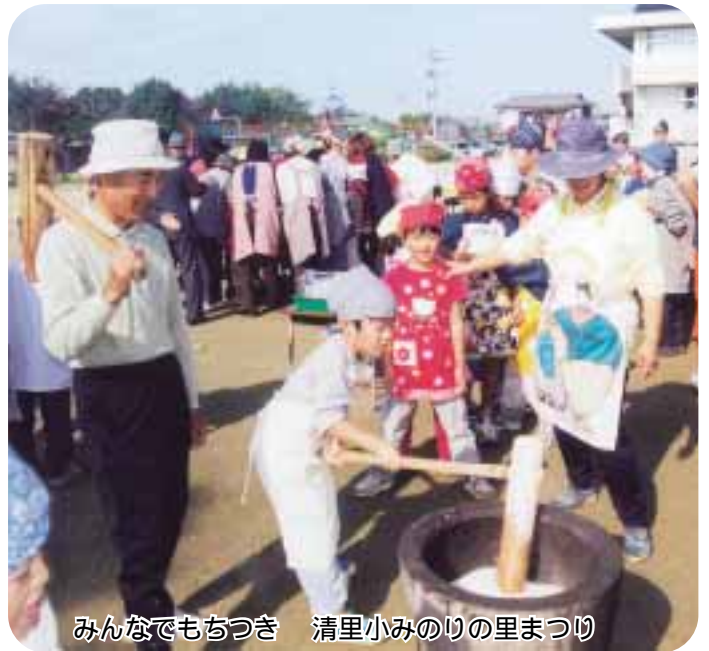
みんなでもちつき 清里小みのりの里まつり

それぞれの取り組みには、多くの地域住民の方々が参加され、子どもたちを地域で育てるという学社融合の基本的理念のもと、地域と学校の結びつきを深めました。