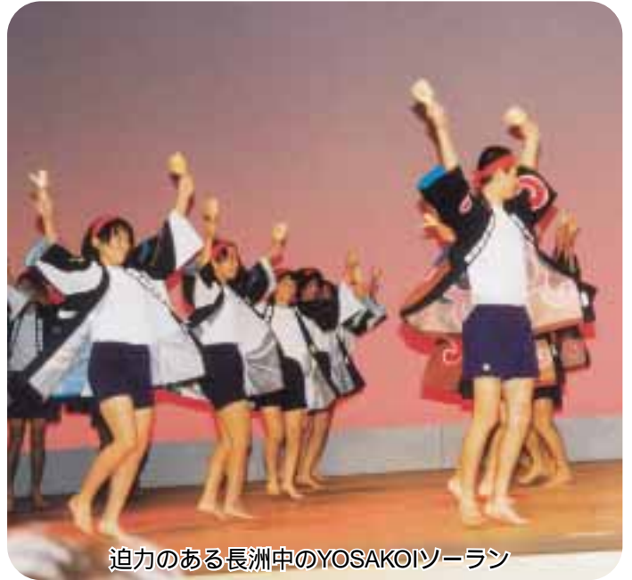
迫力のある長洲中のYOSAKOIソーラン