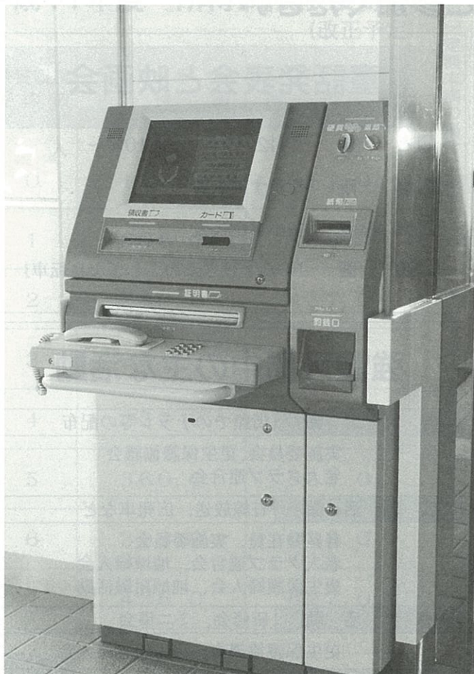
▲ 地域福祉センターの自動交付機

なお、この自動交付機は、ながす未来館に続き2台目の設置となりました。 みなさん、ぜひご利用ください。