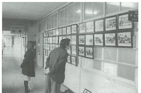
▲職員室前に展示されている卒業写真