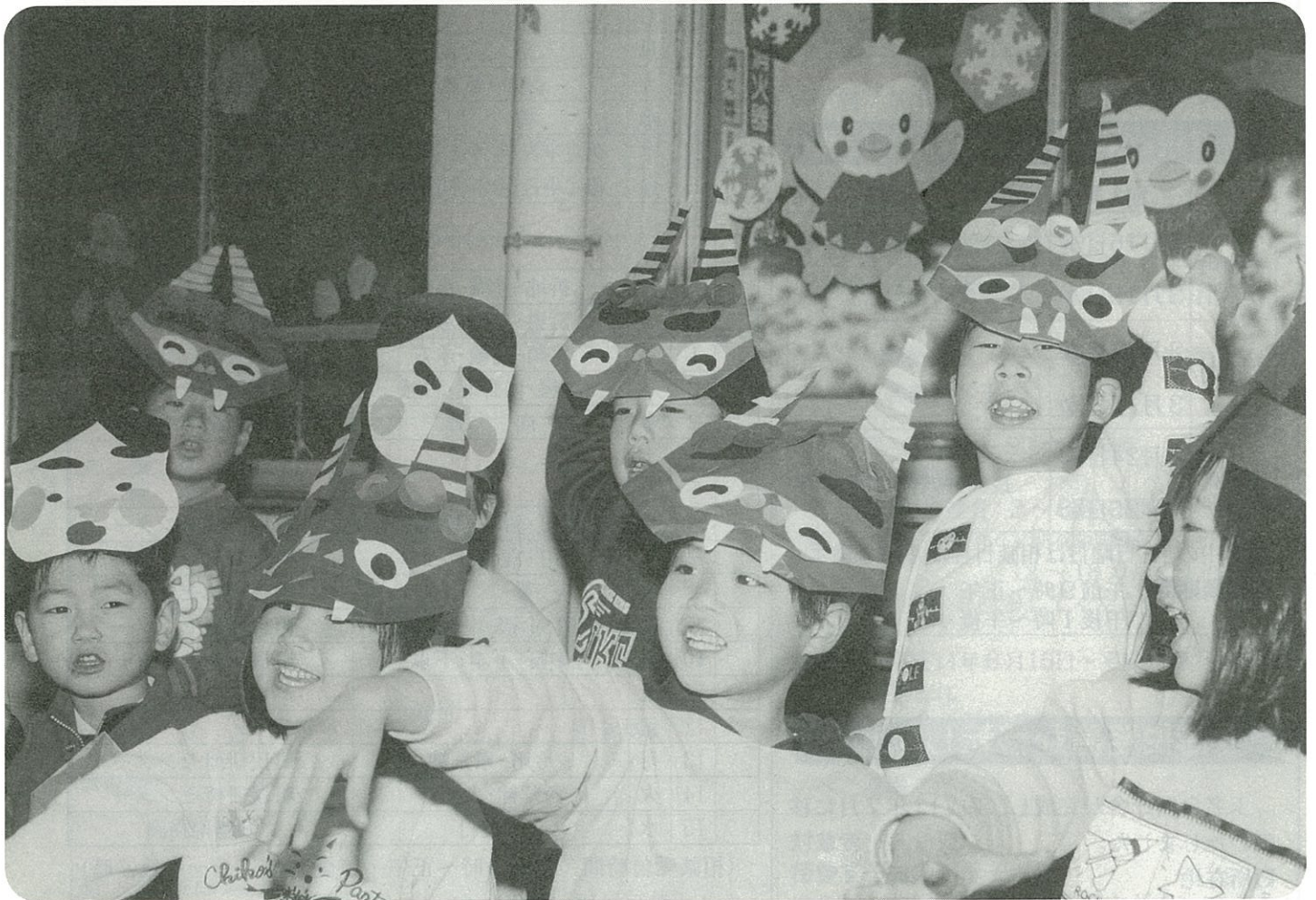
▲ 元気いっぱい豆まきをする清里保育所の園児たち