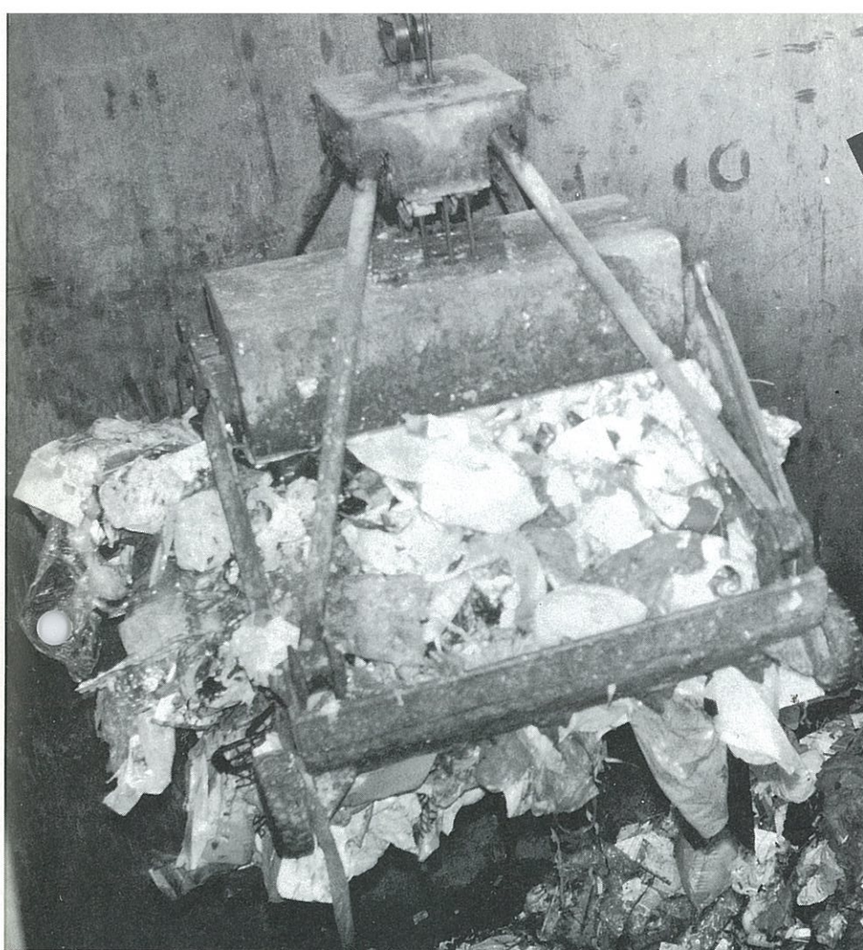
▲今日もまたゴミをくわえている処理場のクレーン