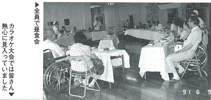
▶全員で昼食会 カラオケ大会では皆さん熱心に見入っていました

肌がカサつくときは、水と油をたっぷり補給しましょう。水分の補給には、木綿のタオルに消炎化粧水か、冷やした豆乳塩を含ませないを浸し、たたく