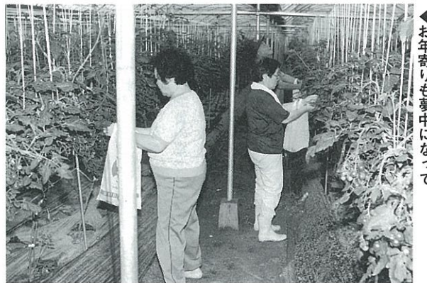
◀お年寄りも夢中になって

この日参加した13名は、農業用の水タンクに水を入れ、トラックに積み込み4班に分かれ、午前9時から3時間程で200本余りのカーブミラーを清掃しました。