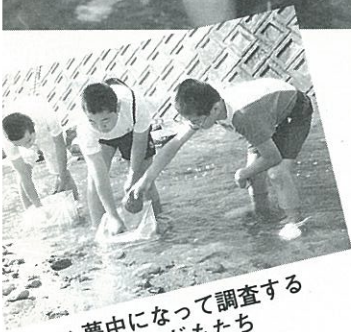
▲夢中になって調査する子どもたち

子どもたちは、川底の石を動かして採集ネットで水をすくい、その中の生き物を虫メガネで観察しながら標本と見比べました。その結果、水の中にはカワナ、カゲロウ、トビゲラなどきれいな水に住む生き物が見つかり、菜切川の上流はきれいな川であることが分かりました。