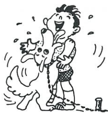
動物愛護週間 (9月20~26日)

無料法律相談 ◆とき 10月1日(火) 午前10時~午後3時 ◆ところ 熊本地方裁判所玉名支部・熊本家庭裁判所玉名支部(玉名市繁根木54-8) ◆相談員 裁判所、検察審査会、法務局各職員及び弁護士、調停委員 ◆相談内容 一般法律問題、家庭問題、人権問題、登記、戸籍、その他