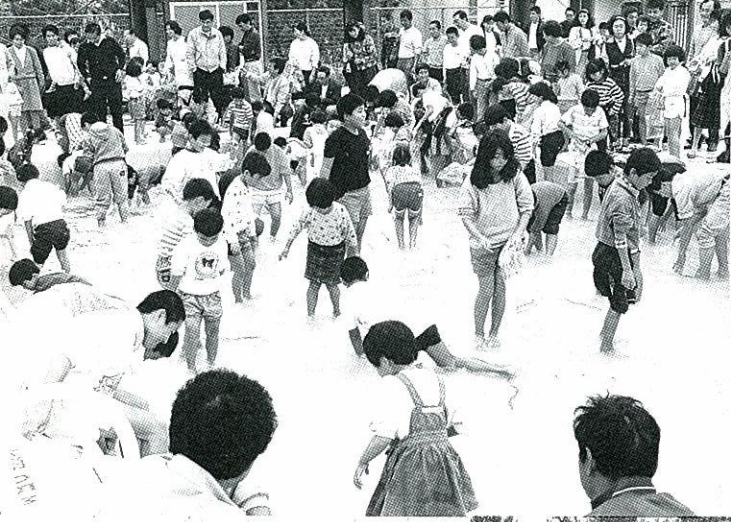
◀ウナギと鯉のつかみどり