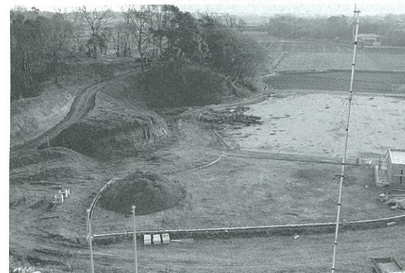
▲来年3月完成予定の古城公園（赤崎）

上半期末（9月30日）現在の歳入予算の収入額は27億2,580万円（収入率61.0%）で前年同期より14%の増となっています。例年のことながら国庫支出金、町債等が建設事業の完成時期である下半期に収入されるため、このような低い率となっています。