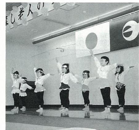
保育園児による遊戯

町社会福祉協議会は2月24日、健康福祉センターで「第4回ひとり暮らし老人のつどい」を開催しました。 この日招待された100名のお年寄りたちは、保育園児の遊戯や豊洲会による民謡、琴和会による大正琴の演奏、そして民生児童委員婦人部と町社協事務局の女子職員によるコーラスなど多彩な催し物で、楽しい一日を過ごしました。