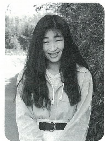
ほほえ美さん ③③ 腹赤

好きな科目は体育、なかでも特意的なのが走ることです。今はピアノ、習字、水泳、詩吟それに破魔弓太鼓を習っています。 将来は、カッコいい婦人警官になりたいです。