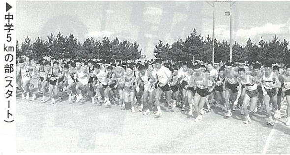
中学5kmの部(スタート)