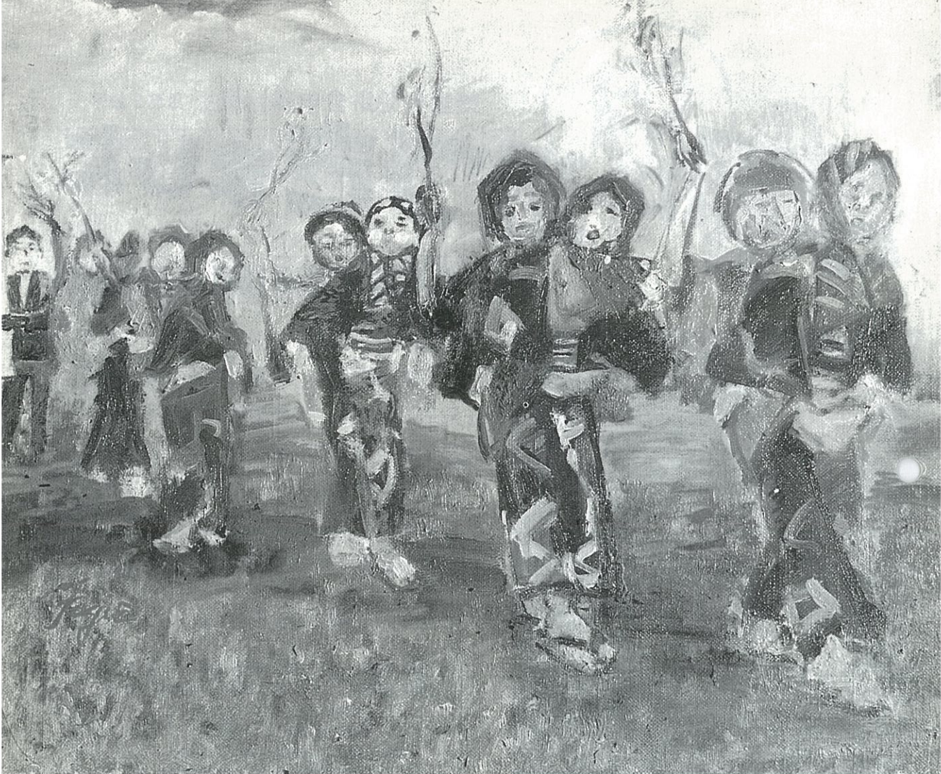
〈絵／津田フジエさん〉