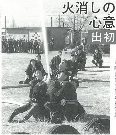
悪戦苦闘の玉落し競技

平成3年長洲町消防出初式が 1月13日、腹赤小学校グラウン ドに町内15分団の精鋭約370