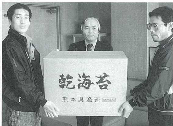
▶町長に焼のりを手渡す長洲漁協

優勝 上沖洲子ども会A 2位 清源寺子ども会A 3位 折地子ども会A、清源寺子ども会B