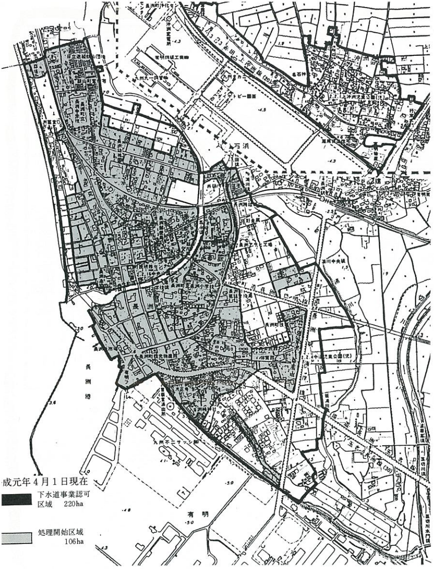
成元年4月1日現在 下水道事業認可区域 220ha 処理開始区域 106ha

水洗化すると、当然のこととして利用者の方は、下水道の使用料金を払わなければなりません。