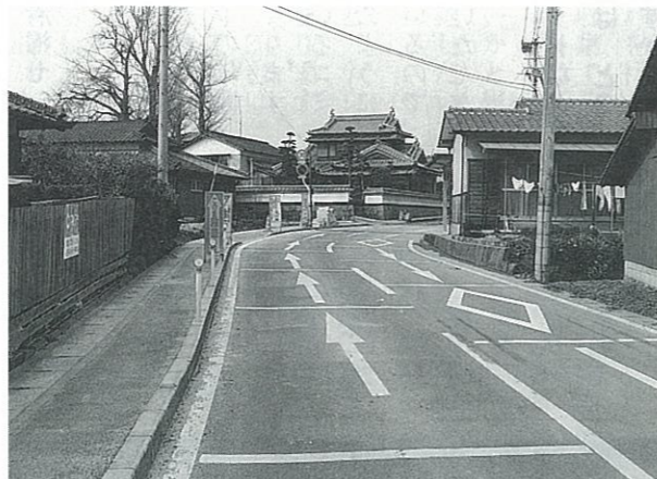
▲昨年、原付車による死亡事故が発生した現場