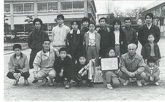
六栄校区で優勝した鷺巣チーム