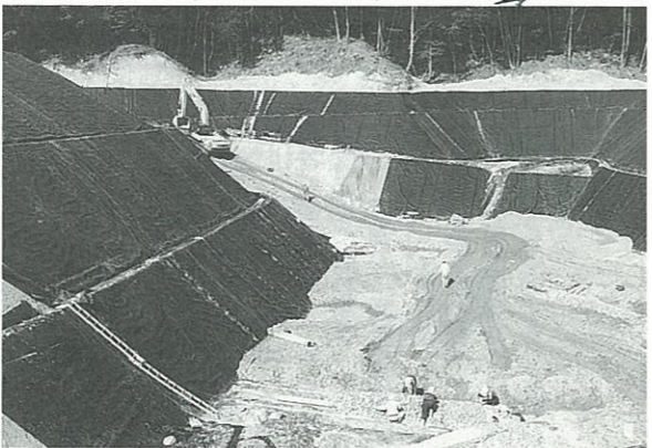
▶小岱山のふもとにある3月末完成予定の最終処分場。ここには、清掃センターで焼却して残った灰を埋めます。

所長 ゴミ処理については、すべて町に依存しようとする傾向が、このような結果をもたらしたのだと思います。また、できるだけゴミを出さないようなくふうをしていただきたいです。