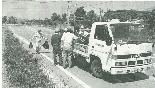
▼ビニール袋がすぐ満杯に!