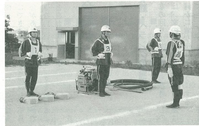
▼大会に向けて練習に励む第9分団の選手たち