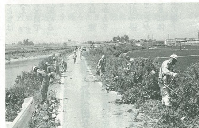
▼慣れた手つきで草を刈り取る組合員