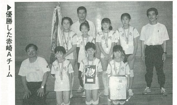
▶優勝した赤崎Aチーム

身近な話題、出来事などありましたら、お気軽に企画課(☎78-3111内線221)へ。