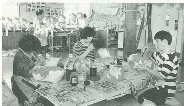
▶色付けを行う地域組織活動のメンバー

また、同協議会では、美化作業の推進を通して地域環境をより良いものにし、災害のない安全な職場づくりに努めています。