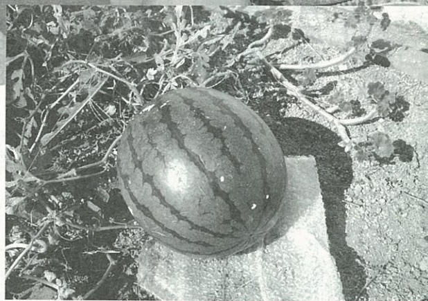
◀花だんで大きく育ったスイカ

それから収穫までの間は、毎日少しずつ大きくなっていくスイカを大事に育て、収穫されたスイカは園児らみんなで味わいました。