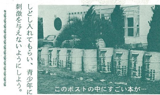
刺激を与えないようにしよう。

す。 紙の落しふたを 強火で加熱すると鍋の中の材料がおどりだします。これを防ぐためと、煮汁を十分に浸み込ませるために、落しふたが必要ですが、木の落しふたはそれ自体重いので、デリケートな材料にかぶせると、かえって煮くずれさせることになりかねません。和紙やパラフィン紙の落しふたを用意しましょう。ところどころに穴をあけ、ふきこぼれを防ぎます。もし和紙やパラフィン紙がない時には、アルミ箔を使いましょ。