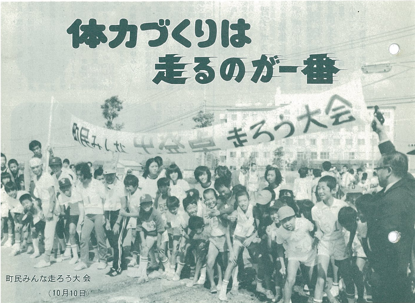
町民みんな走ろう大会 (10月10日)