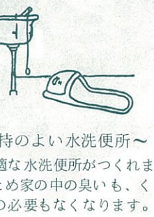
～気持ちのよい水洗便所～ 快適な水洗便所がつくれます。このため家の中の臭いも、くみ取りの必要もなくなります。

人間だけのものではなく、すべての生物にとっても生命の根源なのです。また川や海だけの水域は人間のいこの場でもありません。