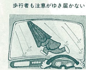
歩行者も注意がゆき届かない