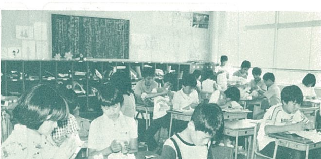
(彼らなりにいろいろと考えている)

大人に望むこと ①今の大人は、近所でも車で行くが、もう少し歩くようにしたらよいと思います。