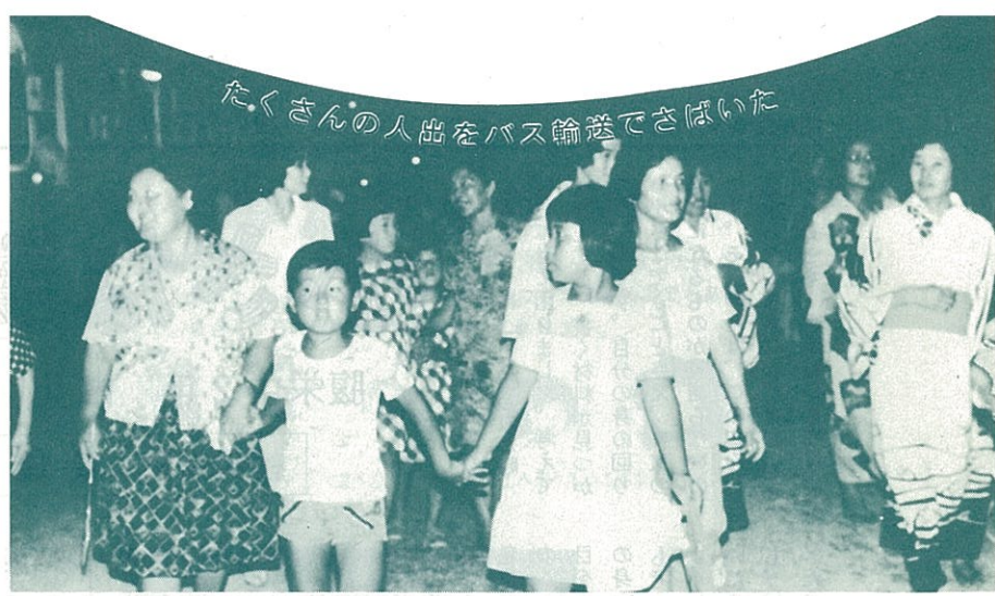
たくさんのお出をバス輸送でさばいた