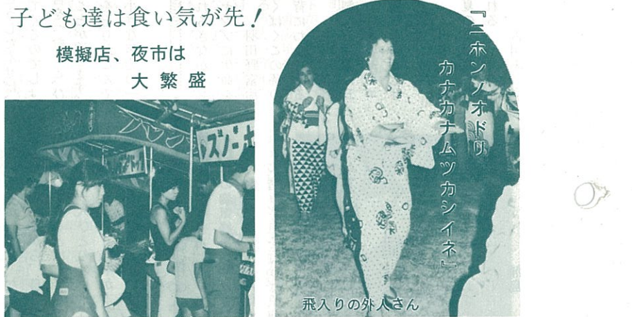
「ニホンノオドル」カチカチムツカシイネ