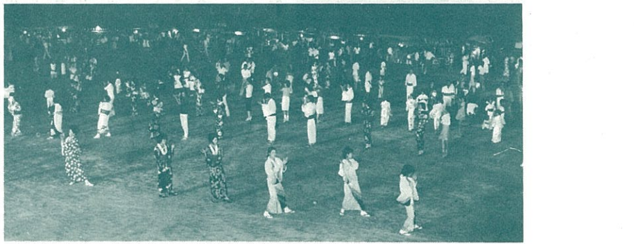
飛入りの外人さん