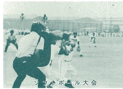
ソフトボール大会

記念行事の子ども会ソフト大会は、男子西新宮、女子は下東チームが優勝した。また、リレー大会は最高の盛り上がりを見せ、激戦の結果男子平原区、女子向野区がそれぞれ一位だった。