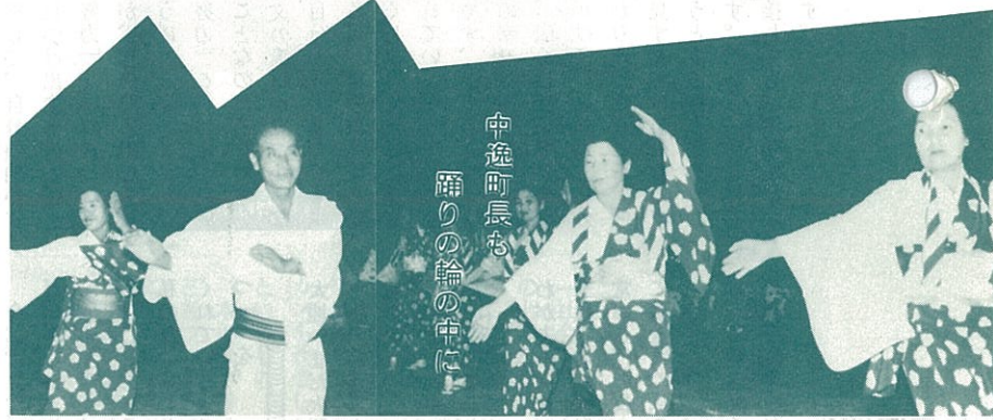
中逸町長も踊りの輪の中に