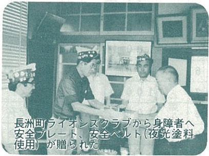
長洲町ライオンズクラブから身障者へ安全ブレード、安全ベルト(夜光塗料使用)が贈られた

昭和五十二年老人健康診査を次により実施します。 受診対象者 大正二年三月三十一日以前に生まれた者 受診期間 昭和五十二年十月一日から同年十月三十一日まで 受診方法 長洲町内の医療機関でしたらどここの医院でも受けられます。 受診料 無料