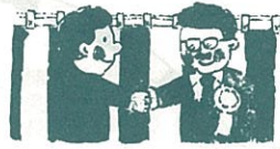
昭和32年 ・長洲町と腹赤村が合併する