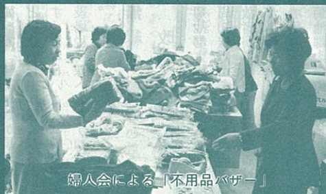
婦人会による「不用品バザー」