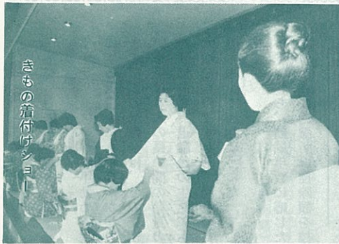
きもの着付けショー