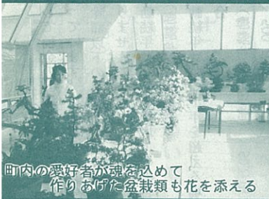
町内の愛好者が魂を込めて 作りあげた盆栽類も花を添える