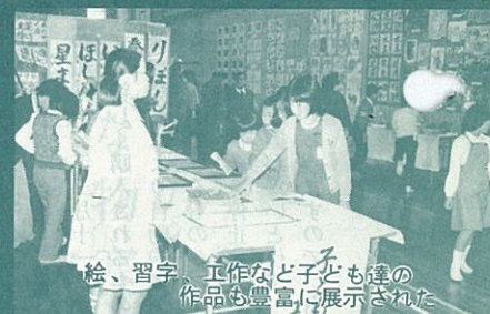
絵、習字、工作など子ども達の 作品も豊富に展示された

十二月四日 浦島医院 (出町) 〇〇五〇 十二月十一日 池本医院 (上東) 〇〇五二七 十二月十八日 六栄診療所 (宮崎) 〇〇二〇一 十二月二十五日 多田隈医院 (向野) 〇三〇一一 原則として午前九時から午後五 時までで往診はいたしません。