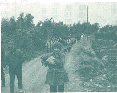
清里地区の「第一回歩け歩け大会」は二月十一日行われた。

午前九時半、清里小通りに集合したのは大道地区館長、各区長さんをはじめ、幼児から七十八歳のお婆ちゃんまで九十名。元氣に一先宮まで出発した。 ゆっくり約四十分歩いて到着した。一先宮前広場で全員体操をした後、踊りやゲーム、 宝探し等を楽しみ、和気あいあいに中食をとった。 帰途、久しぶりに歩いて見ると、本町の変化にみんなが目を見張っていた。建浜公民館では婦人会の心づくしのせんざいに喜び、今後定期的な開こうと話合