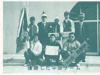
優勝した平原チーム

「平原」が優勝 35チームが参加 町駅伝大会 三位 清源寺 A 46分00秒 四位 小山工業 46分15秒 五位 腹中野球部 C 47分30秒 六位 丸一鋼管 A 47分43秒 致謝賞 小山工業(前年36位)