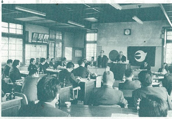
長洲町第二回臨時議会は二月十三日招集され、中逸町長の挨拶のあと、会期は二月十三日の一日と決め、ただちに審議が行われた。

長洲町第1回定例議会は3月11日招集された。会議録署名議員を指名したあと、会期を3月11日から3月23日までの13日間と決め、中逸町長の挨拶、福永議長から閉会中の諸報告があり、ただちに会議には入った。今議会は53年度本町の予算審議も含まれており、そのためか、いつもの議会よりもさらに活発な討議が繰り返された。3月16日には町長が今年度の施政方針を述べた。結果は次の通りである。