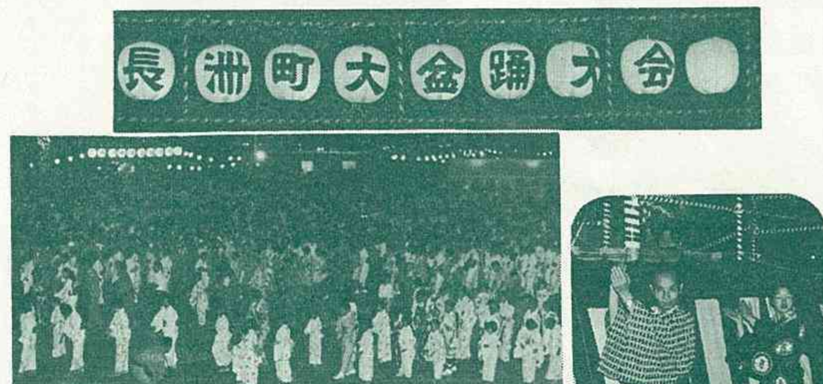
8月5日、長洲町大盆踊大会が日立造船グラウンドで盛大に行なわれた。日立造船と町商工会の後援で、福引きも行なわれ、又、夜市、模擬店にも人気が集まった。夏の夜の納涼を求めて集まった約1万5千の人は、やぐらを囲み、夜の更けるのも忘れて、踊った。夜空を彩る花火も踊り気分を一層盛り立てた。この盆踊り大会は、今後も毎年、行なわれる予定である。