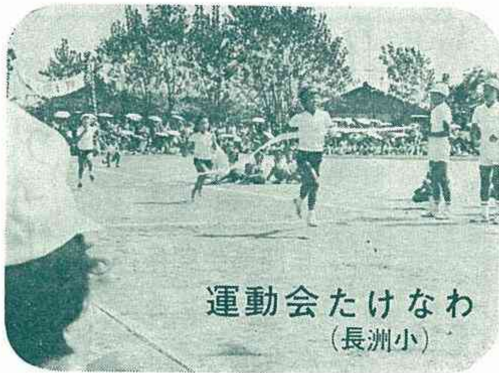
運動会たけなわ (長洲小)