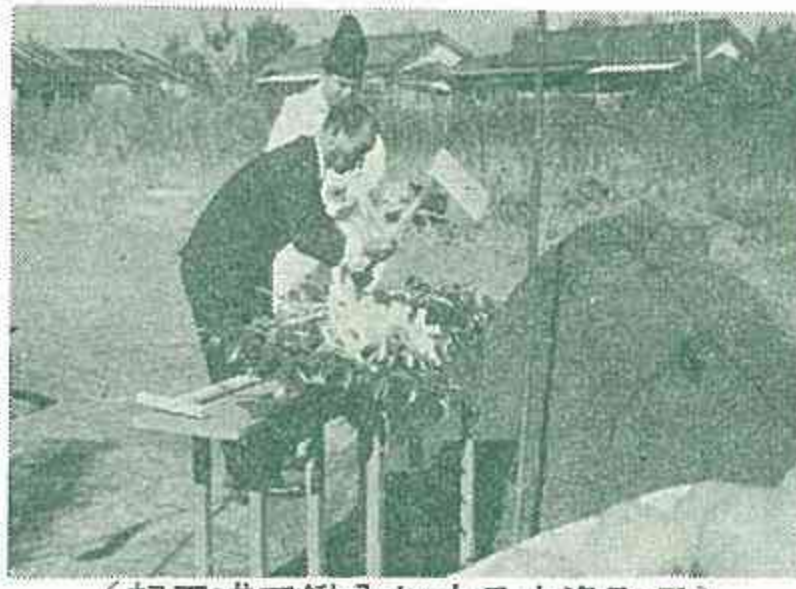
(起工式で鑑入れする中逸町長)

長洲第一保育所が出町町営住宅南に移転新築されます。鉄筋コンクリート造平家建七五〇、二二二㎡で園児を一五〇