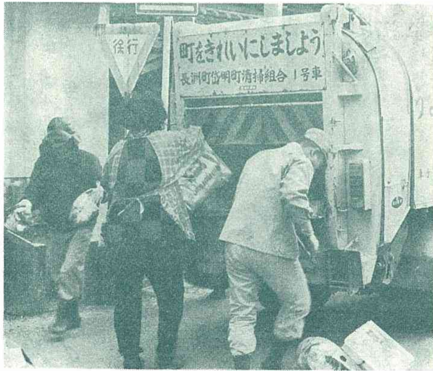
(今日もじん芥収集車は陰の力として動く)