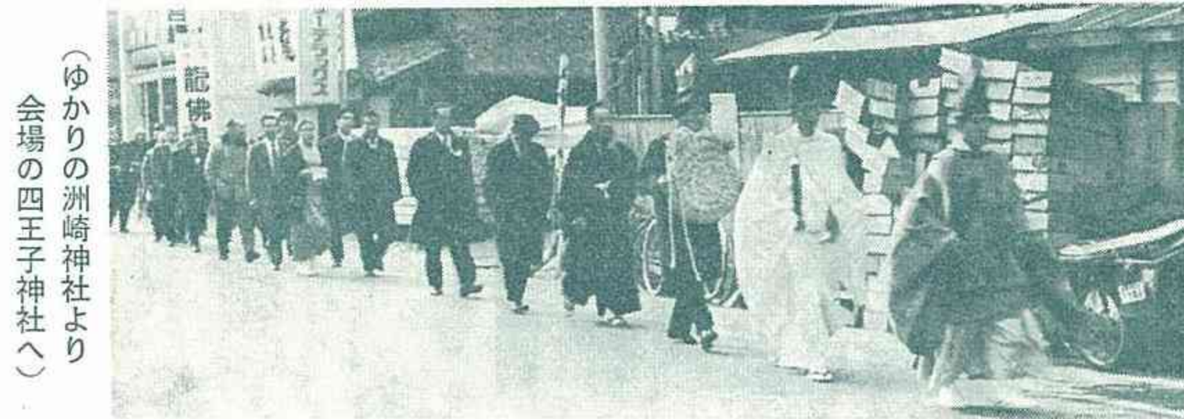
会場の四王子神社へ