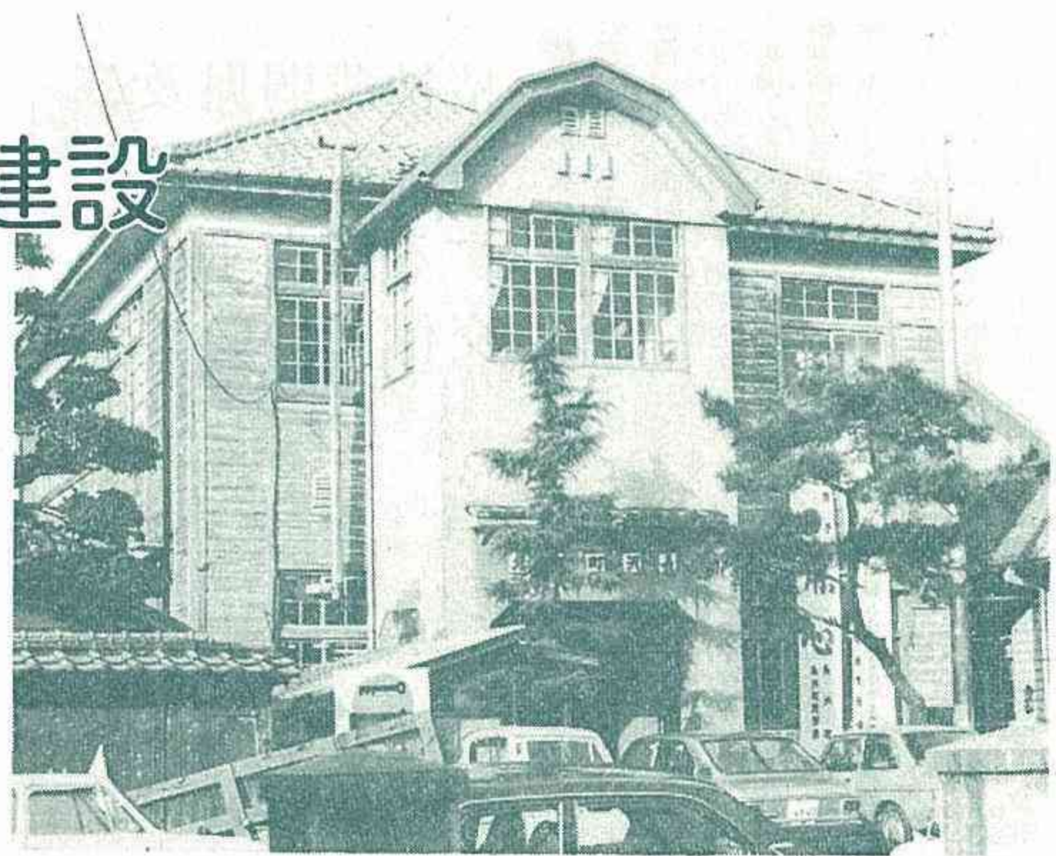
37歳を迎えようとする役場庁舎