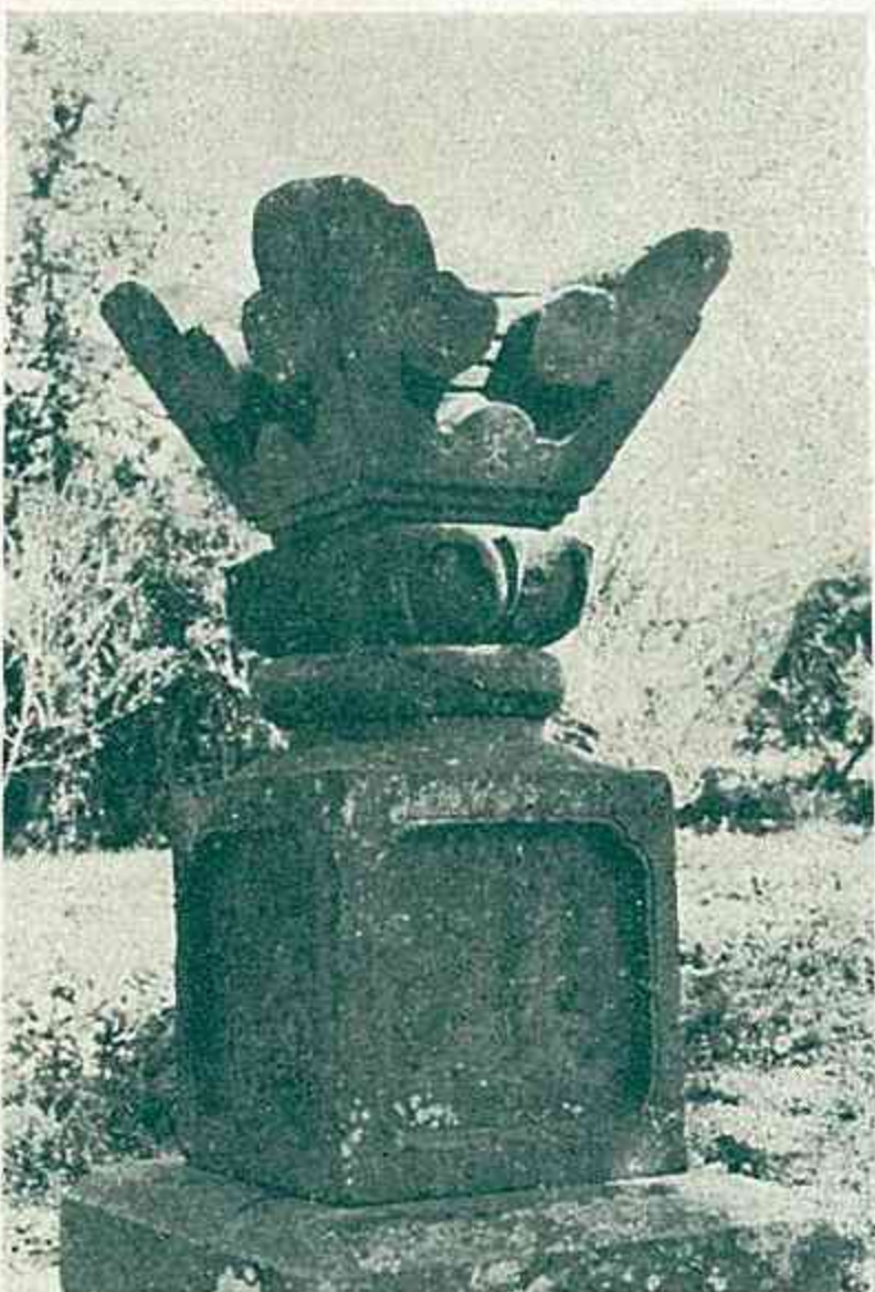
(腹赤天満宮にある宝篋印塔)

宝篋印塔は平安時代の中期に中国から伝ってきたものといわれる。釈迦の死後百年たって、印度摩竭陀国に君臨していた阿育王(アショカ王)が八万四千の塔を建立し、釈迦の遺骨(仏舎利)をこれに取めた故事にならひ、呉越王弘叙が中国の各地に金塗塔を建立したが、その源流であるという。それが平安中期に日本に伝来し、平安末期につくられた塔は木造八センチ位の粗塔であった。それが鎌倉時代に入って石造の塔がつくられ、宝篋印陀羅尼経や法華経等を納め故人の供養塔として盛んに建立するようになったのである。室町時代には小型の墓塔に