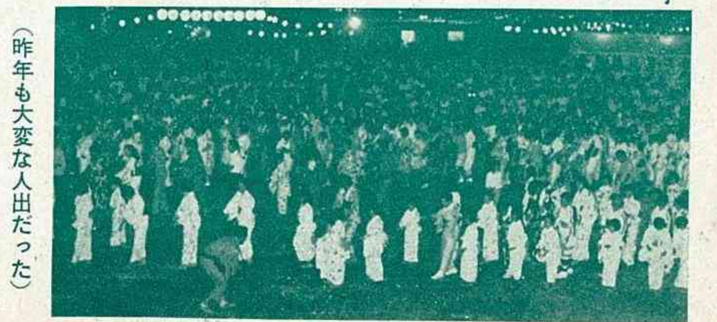
(昨年大変な人出だった)

◎ バス配車 ※ 配車時間 午後5時～11時 (1)長洲地区 日立新山社宅～宮の前～日立グラウンド (2)清里地区 国鉄長洲駅～日立グラウンド (3)六栄地区 日立宮野社宅前～日立グラウンド (4)腹赤地区 腹赤農協前～日立グラウンド