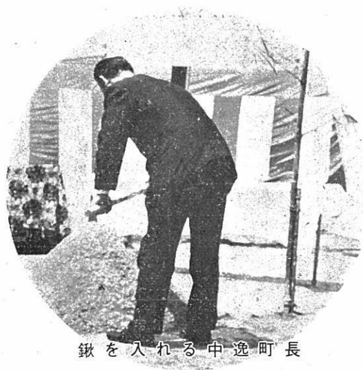
中逸町長 鋤を入れる