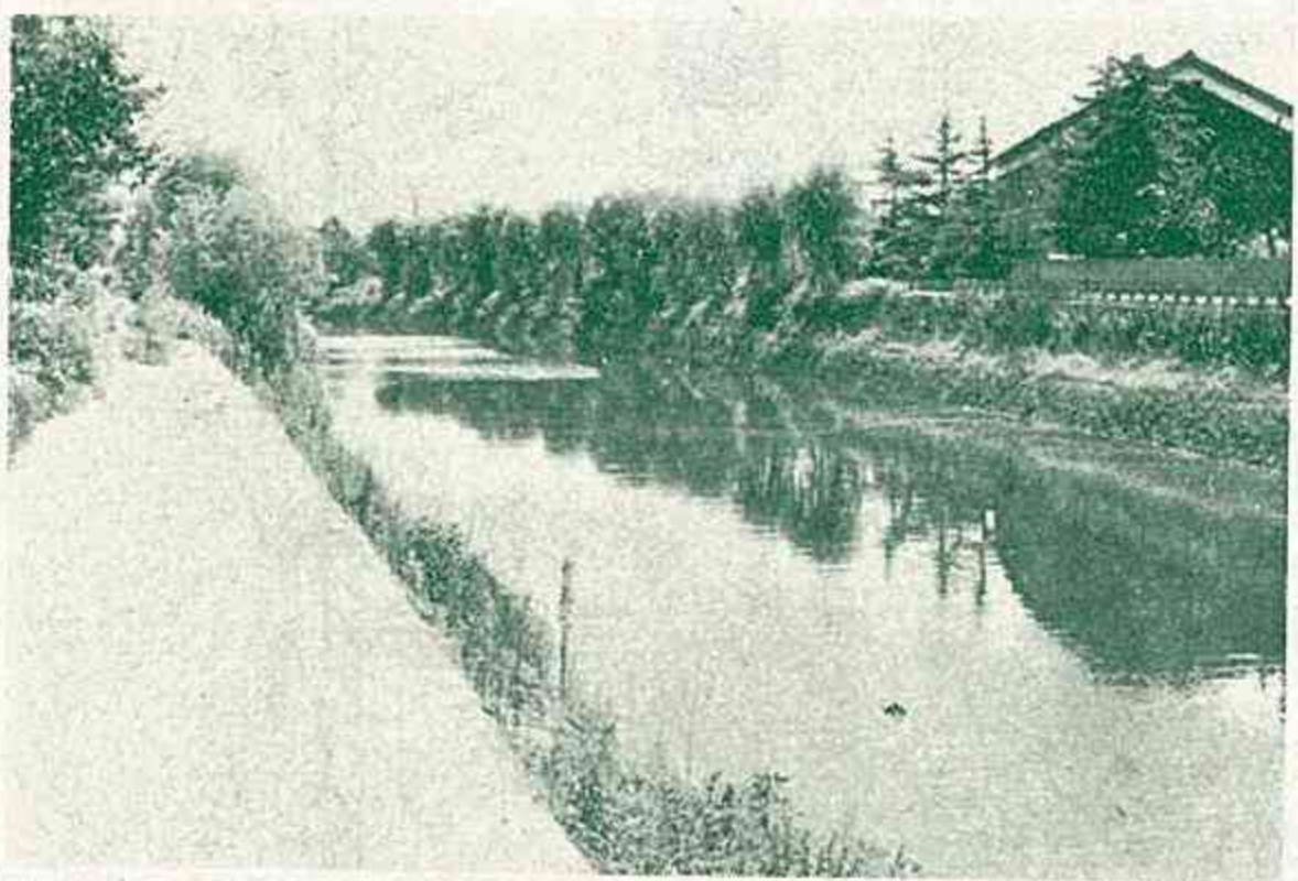
長洲小学校横を流れる通称「新川」

海の潮流により、砂を吐水口に蓄積され、放水の用をなさなくなり、新しく、嘉永三年(一八五〇)から同五年まで三年間かかって掘られたのが今の嘉永川の前身である。玉名郡誌には、「嘉永川、嘉永五年(一八五二)深処三尺、浅処二尺、広処八間、狭処四間、緩流、水濁、味淡、舟筏通ず。堤防なし。村の北、古塘川より分れ、坤に流れ海に入る。その間、十二町三十三間なり。」と記録されている。古塘川とは浦川のことであろう。