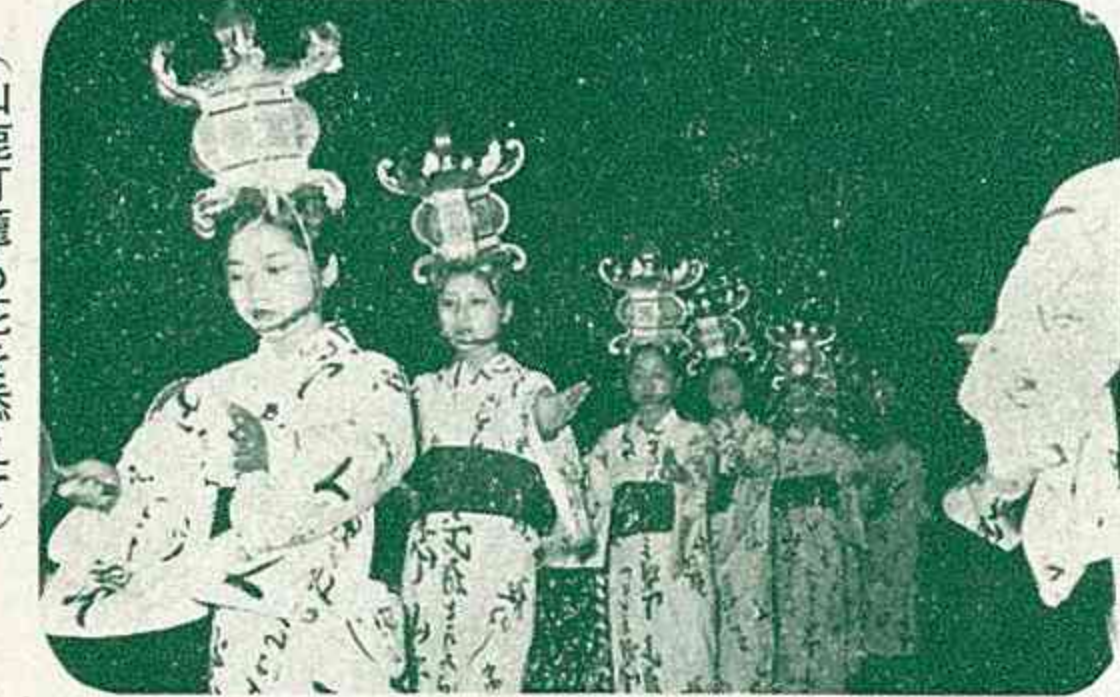
(山鹿灯籠も花を添えて)