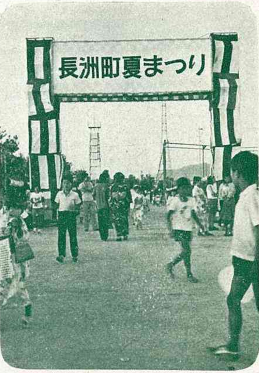
(6時頃になるとぞくぞくの人出)

第二回目を迎えた「長洲町夏まつり」は八月三日夜、日立造船グラウンドで行われた。町内はもとより近郊からもた