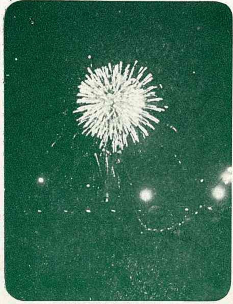
(夜空を飾った数々の花火)