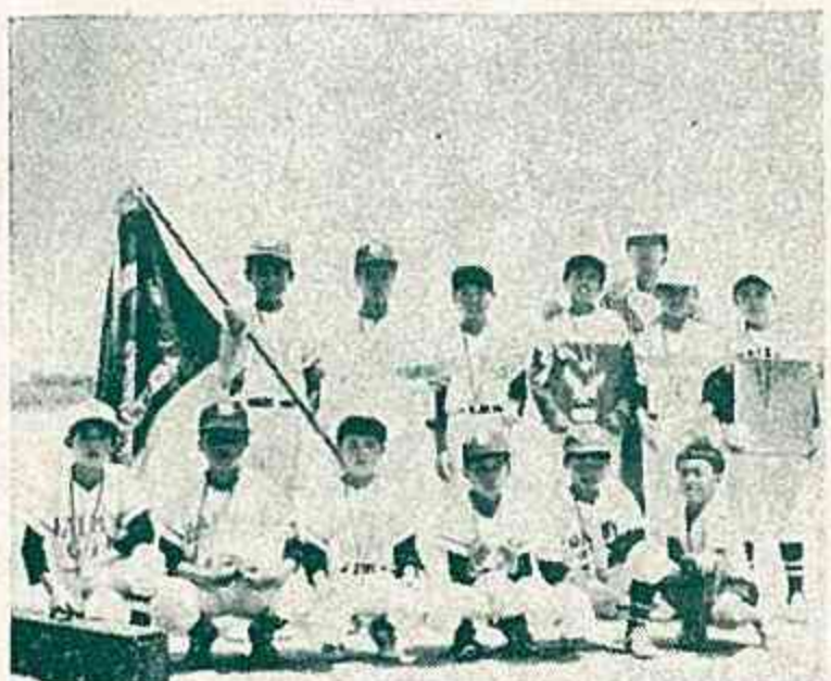
(優勝した大明神チーム)