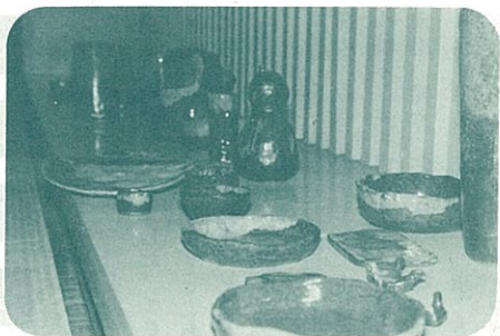
(やきもの教室できれいにやかれた小岱焼)