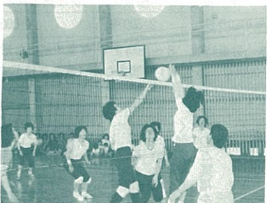
清里校区が優勝 (婦人会バレー大会) 5月25日婦人会総会のあと行なわれ、清里校区が優勝した